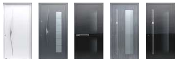
628 A ALU → 36 628 ALU → 36 634 GLASS → 18 635 ALU → 19 635 GLASS → 17