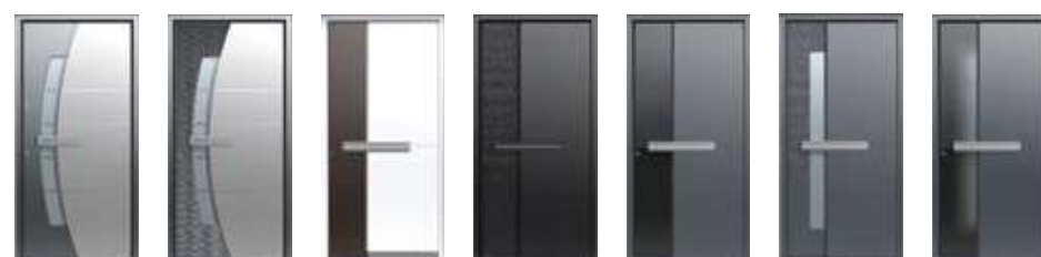
510 ALU → 48 510 DUNE → 49 515 A ALU → 40 515 A DUNE → 41 515 A GLASS → 41 515 DUNE → 42 515 GLASS → 42