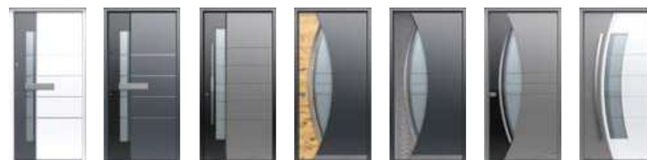
505 ALU → 51 505 GLASS → 51 506 GLASS → 56 507 ALU → 46 507 DUNE → 47 507 GLASS → 46 509 ALU → 48