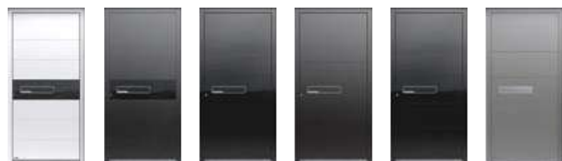
607 A ALU → 34 608 A GLASS → 33 611 A GLASS → 30 612 A GLASS → 28 613 A GLASS → 31 613 A ALU → 31