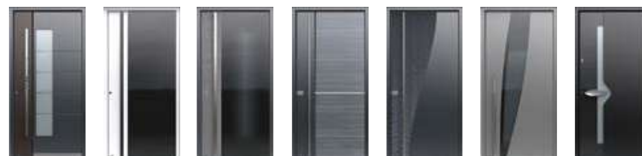
517 ALU → 57 523 A ALU → 45 523 DUNE → 45 524 A ALU → 52 527A DUNE → 54 529 ALU → 59 530 GLASS → 60

Lasciate che i nostri capolavori pluripremiati vi impressionino dal vivo! Provateli nella nostra sala d'esposizione.