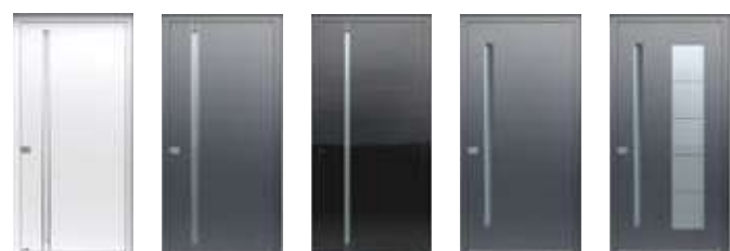
624 A ALU → 24 624 ALU → 24 624 GLASS → 25 626 A ALU → 23 626 ALU → 22